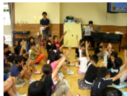
(県内大学生による食育のクイズ)