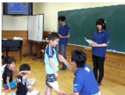
(県内大学生による食育の紙芝居)

指定地域を中心とした小学校の児童を対象に、全校集会の時間に給食集会として45分間開催した。また、今回は授業参観も兼ねて行った学校もあった。事後は学級担任や栄養教諭等による再指導と、キャラバン隊に向けた感想文の作成が行われ、給食だよりや食育だより、学校だよりなどで家庭にも実施内容が伝えられた。