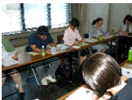
(連絡協議会での食育の情報交換)