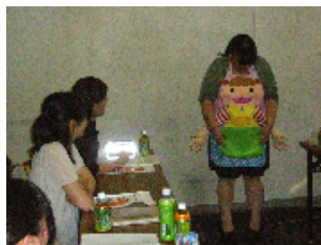
(教具の活用方法の協議)