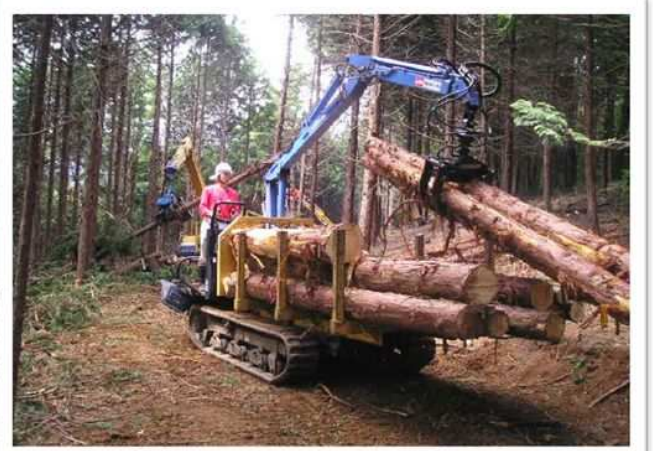
森林作業道の作業状況(イメージ)