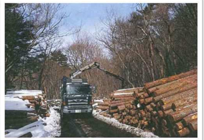
林業生産基盤整備道(イメージ)