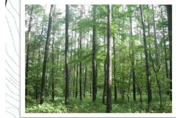
収穫間伐予定箇所林況