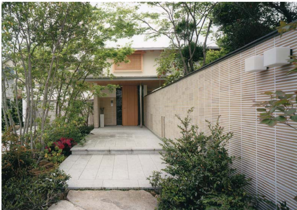
玄関へのアプローチ（外観）