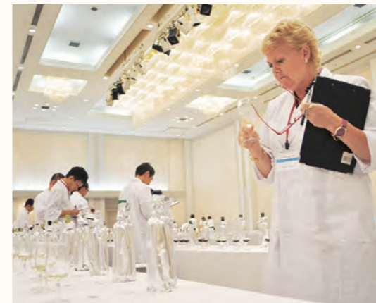
出品ワインを審査する、マスター・オブ・ワイン協会・会長のリン・シェリフ氏

国内で栽培されたブドウを100%使用したワインを対象とした「国産ワインコンクール2012」の審査が、7月に甲府市内で行われました。10回目を迎えた今年は、24道府県の1000ワインナリーから合計690点の出品があり、審査の結果353点が入賞。金賞には34点が選ばれ、このうち22点は県内のワイナリーで醸造されたものです。 9月1日には、10周年を記念した講演とシンポジウムが、翌日には、入賞ワインの試飲が楽しめる公開ティastingも行われました。