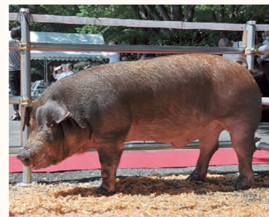
「フジザクラDB」と名付けられた新系統豚

山梨県独自の種豚「フジザクラDB」の完成披露式典を7月17日、県畜産試験場で行いました。この種豚は、肉質に特徴のある「デュロック種」と「バークシャー種」（黒豚）の2品種を掛け合わせ7世代にわたり交配・選抜を繰り返して完成させたものです。肉質はきめが細かくやわらかで、上質な脂肪を持ち合わせています。