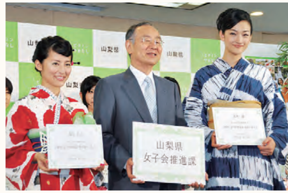
一日課長の富永愛さん(右)と課長補佐の福田彩乃さん(左)

首都圏に住む30〜40代の女性に山梨の優れた観光資源をPRしようとして7月4日「女子会推進課」が発足しました。この課は、「ビタミンやまなし」イメージアップキャンペーンの一環で立ち上げた特命チームで、一日課長にスーパーモデルの富永愛さん、課長補佐にタレントの福田彩乃さんを任命しました。 女子会推進課の女性職員たちは、フェイスブックやブログなどで女子会にお薦めのパワースポットやレストランなどの情報を発信していきます。