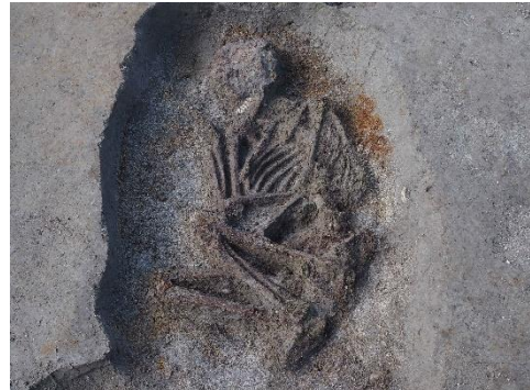
中世の墓跡(二又第1遺跡)