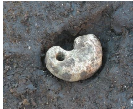
弥生時代の勾玉(塚越遺跡)