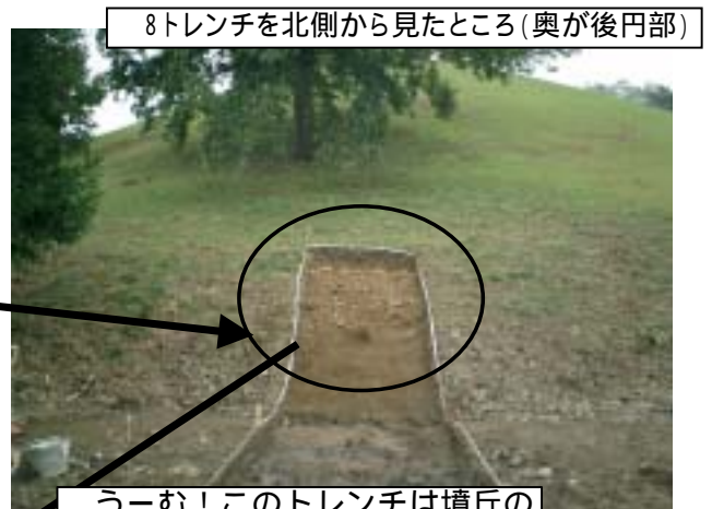
8トレンチを北側から見たところ(奥が後円部)