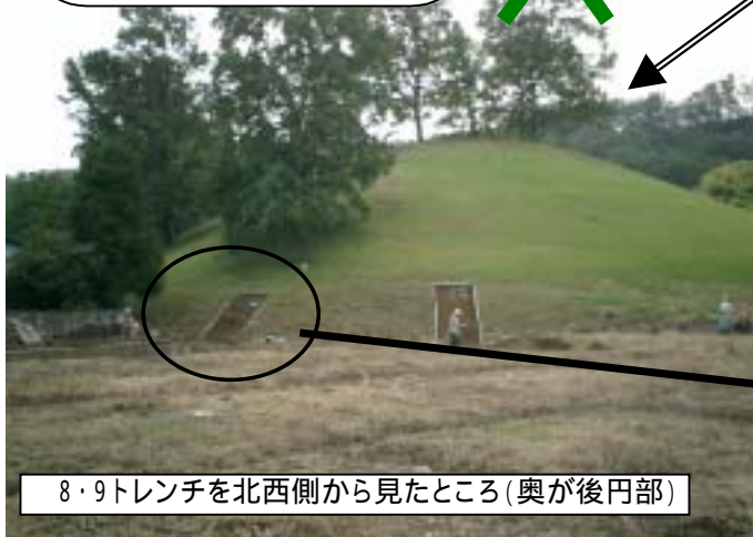
8・9トレンチを北西側から見たところ(奥が後円部)