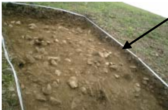
8トレンチのようす(葺石の崩れたものや埴輪が散らばっています)

うーむ！このトレンチは墳丘のようすや墳丘の範囲、周溝の範囲や深さがわかるかもしれない重要なトレンチだねえ。 水がわいてきて大変だけど、やりがいのあるトレンチだよ！