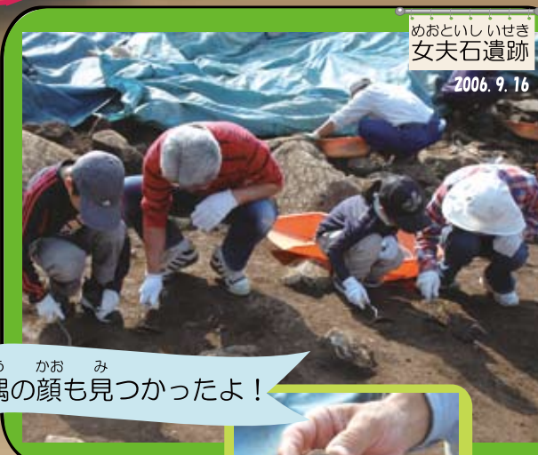
めおとしいせき 女夫石遺跡 2006. 9. 16