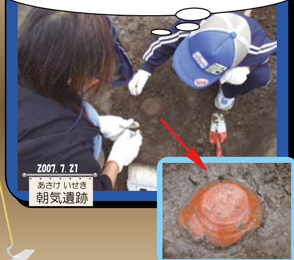
2007. 7. 21 あさけ いせき 朝気遺跡