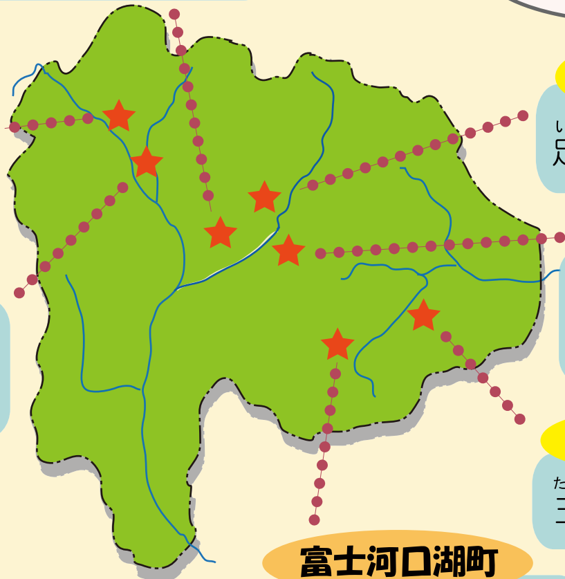
参加者人数の移りかわり