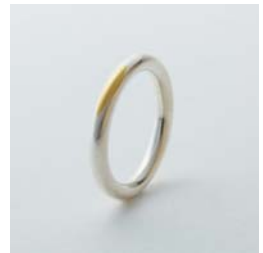
gold wedding ring