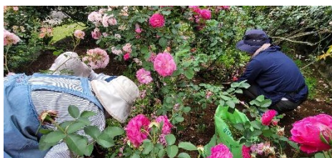
地域貢献でバラ園の除草作業