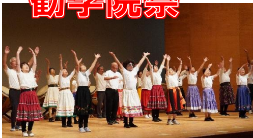
1年生は伝統の『太鼓』に加えて、フォークダンスに挑戦し、華やかなステージに