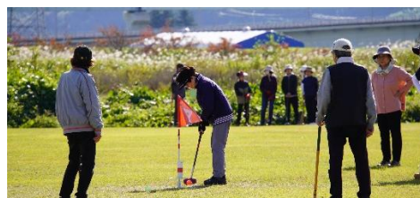
グラウンドゴルフで1・2年生交流深まる