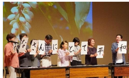
2年生は『平和』への取組を劇に