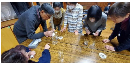
森林研究所での実験に興味津々

熱い講義に引き込まれます。様々な工夫がなされ、講座内容也多岐にわたり、興味深いものばかりです。