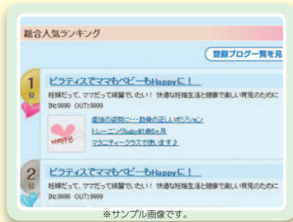
※サンプル画像です。

また、ブログを開設していない方でも、気軽にコメントを投稿でき、情報交換もできます。