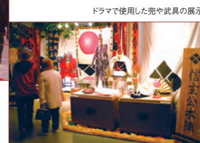
ドラマで使用した兜や武具の展示