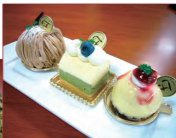
「果樹王国やまなし」のフルーツを使用して、山梨の宝石をイメージして丁寧に作られたケーキ