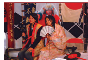
衣装をつけて記念撮影