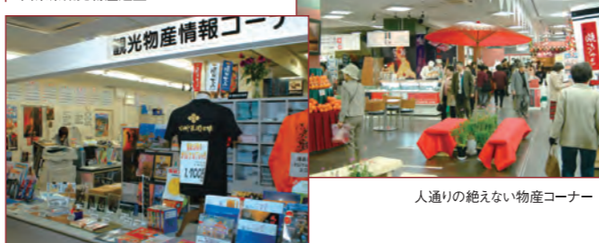
人通りの絶えない物産コーナー

会期：平成19年1月20日(土)～平成20年1月20日(日) 会場：県民情報プラザ特設会場(1階・地下1階) 開場時間：10:00～18:00(1階無料ゾーンは、19:00まで)