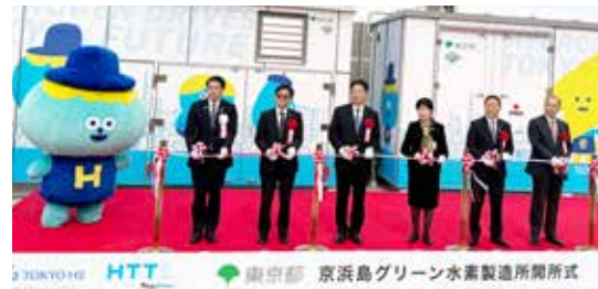
テープカットする長崎知事（左から3人目）、小池知事（右から3人目）と関係者ら

※再生可能エネルギーを利用して水を電気分解し、製造過程でCO 2 を一切出さずに造られた水素のこと。