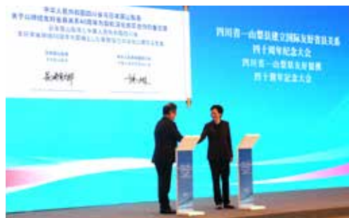
覚書を締結する長崎知事と施小琳（シ・シャオリン）省長（右）