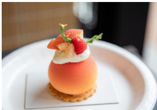
照片说明：2025年大赛各部门最优秀奖获奖作品