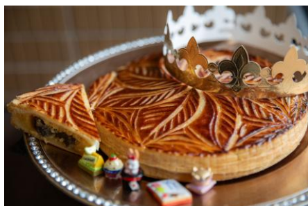
无花果之华／果实的王冠～山梨苹果与枫香的恩惠～