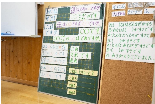
(照片 2 说明) 教室里张贴了通俗易懂的日语例句。