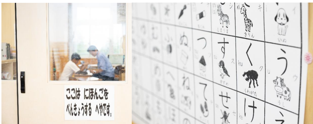
(照片 3 说明) 教学习外国孩子容易理解的平假名