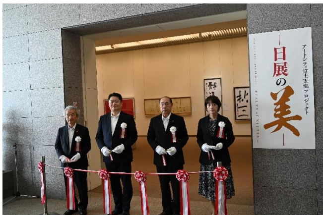
(照片 1 说明) 长崎县知事（左二）与出席者为开幕式剪彩

该县正在努力将富士五湖地区打造成一个有吸引力且有价值的艺术中心，艺术家们可以在这里相互交流和创作。