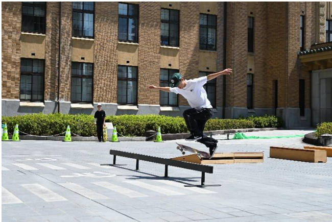
(照片 2 说明) 在县政府庭院展示技巧的滑板手