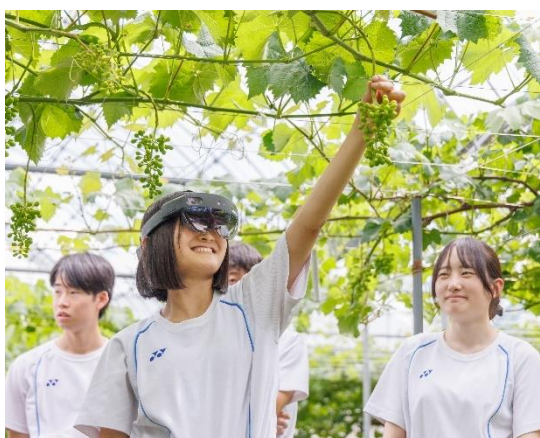
(照片 1 说明) 北斗高中学生体验尖端科技