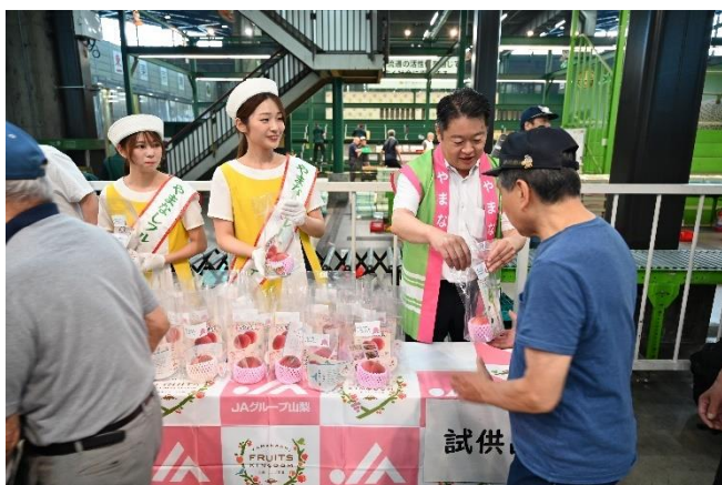
(照片 4 说明) 长崎县知事等在大田市场发放桃子

每年水果季期间都会与县 JA 集团和县议会合作举办顶级销售活动。县内将继续积极宣传县产农畜水产品的魅力, 努力提升山梨品牌价值。