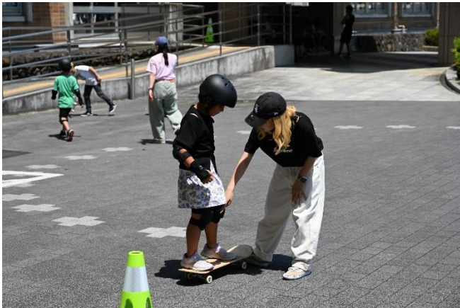
(照片 3 说明) 在启动活动中体验滑板的孩子们