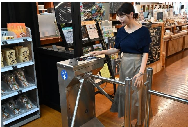
(照片 2 说明) 进入商店时，刷智能手机应用程序上显示的代码