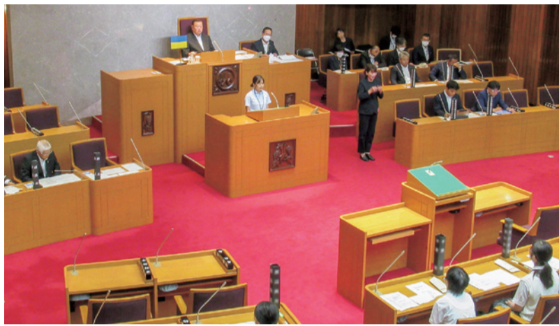
高校生議会の様子

本県の次代を担う高校生に県議会を体験してもらうことで、県政や県議会に対する理解・関心を深め、政治へ参加する意識の向上を図ることを目的に、八月一日、高校生議会を開催しました。当日は、山梨県選挙管理委員会事務局の担当者による主催者教育の後、県内の高等学校、特別支援学校十五校の生徒から、若者の投票率向上、障害の有無にかかわらず誰もが活躍できる山梨の将来像、持続可能な観光地域づくりに向けた取り組みなど県政に対する提言がされ、それぞれの提言に対し所管の常任委員長が講評を述べ、最後に議長が総評を行いました。終了後、参加者にはアンケートに協力していただきました。