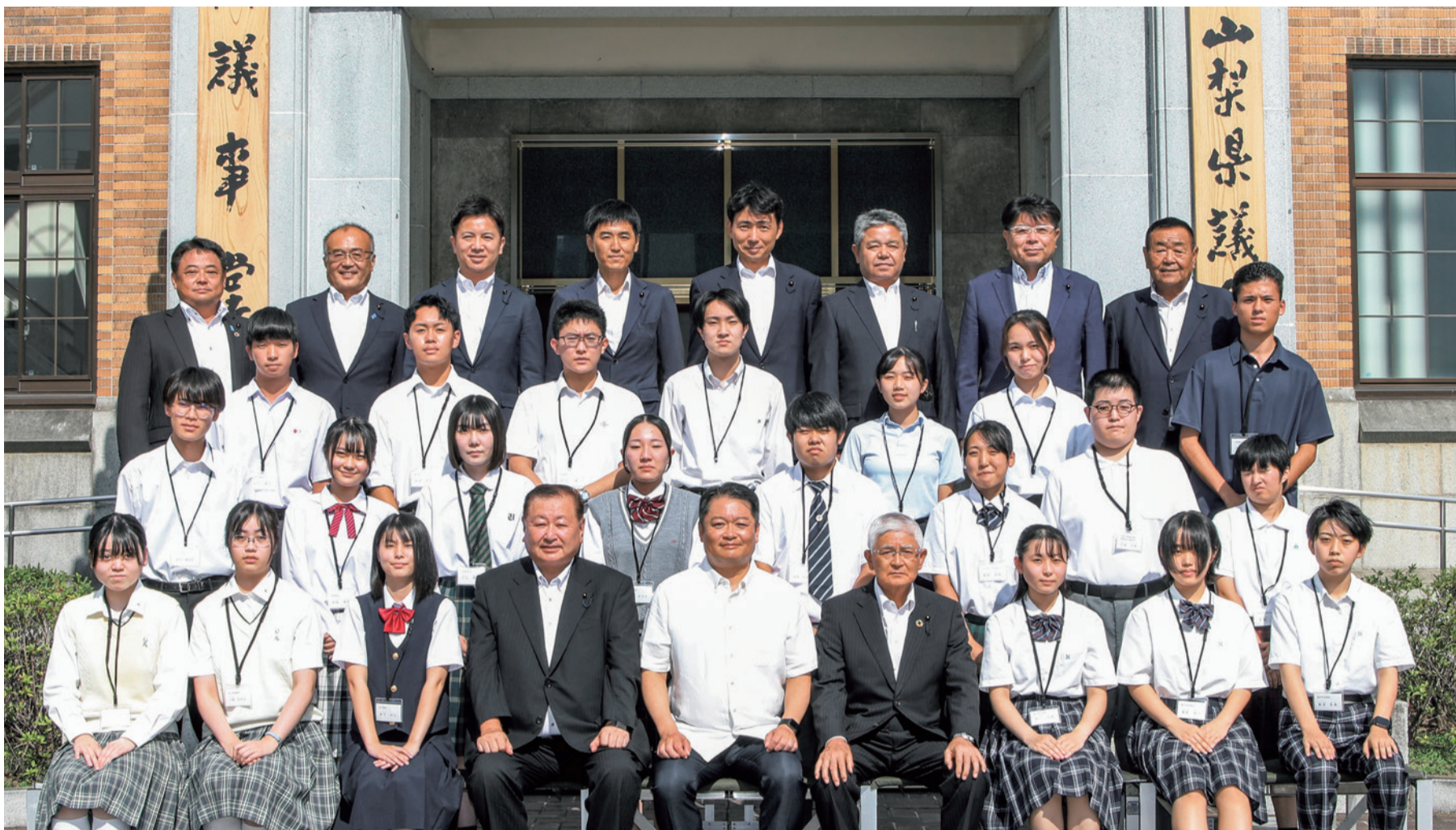
8月1日開催の高校生議会に参加した高校生の皆さん