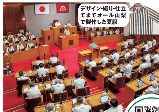
デザイン・織り・仕立てまでオール山梨で製作した夏服

9月26日、9月定例会の開会日に、全議員と県幹部が、富士北麓の繊維産業の活性化や涼しく過ごせる夏服でのエコロジー、山梨の自然なライフスタイルの表現などを目指して製作された「山梨の夏服」を着用し、PRしました。