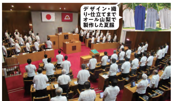
デザイン・織り・仕立てまでオール山梨で製作した夏服

6月定例会の開会日に、全議員と県幹部が、富士北麓の繊維産業の活性化や涼しく過ごせる夏服のエコロジー、山梨の自然なライフスタイルの表現等を目指して製作された「かいくーる」を着用し、PRしました。