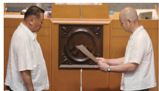
表彰を受ける水岸議員(左)

永年議員の職にあつて県政推進に功績のあった水岸富美男議員(自由民主党 政風やまなし、都留市・西桂町)に対して、卯月政人議長から山梨県議会議長賞が交付されました。