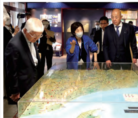
信濃川大河津資料館での視察の様子