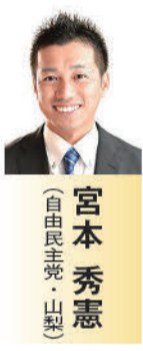
宮本秀憲 (自由民主党・山梨)