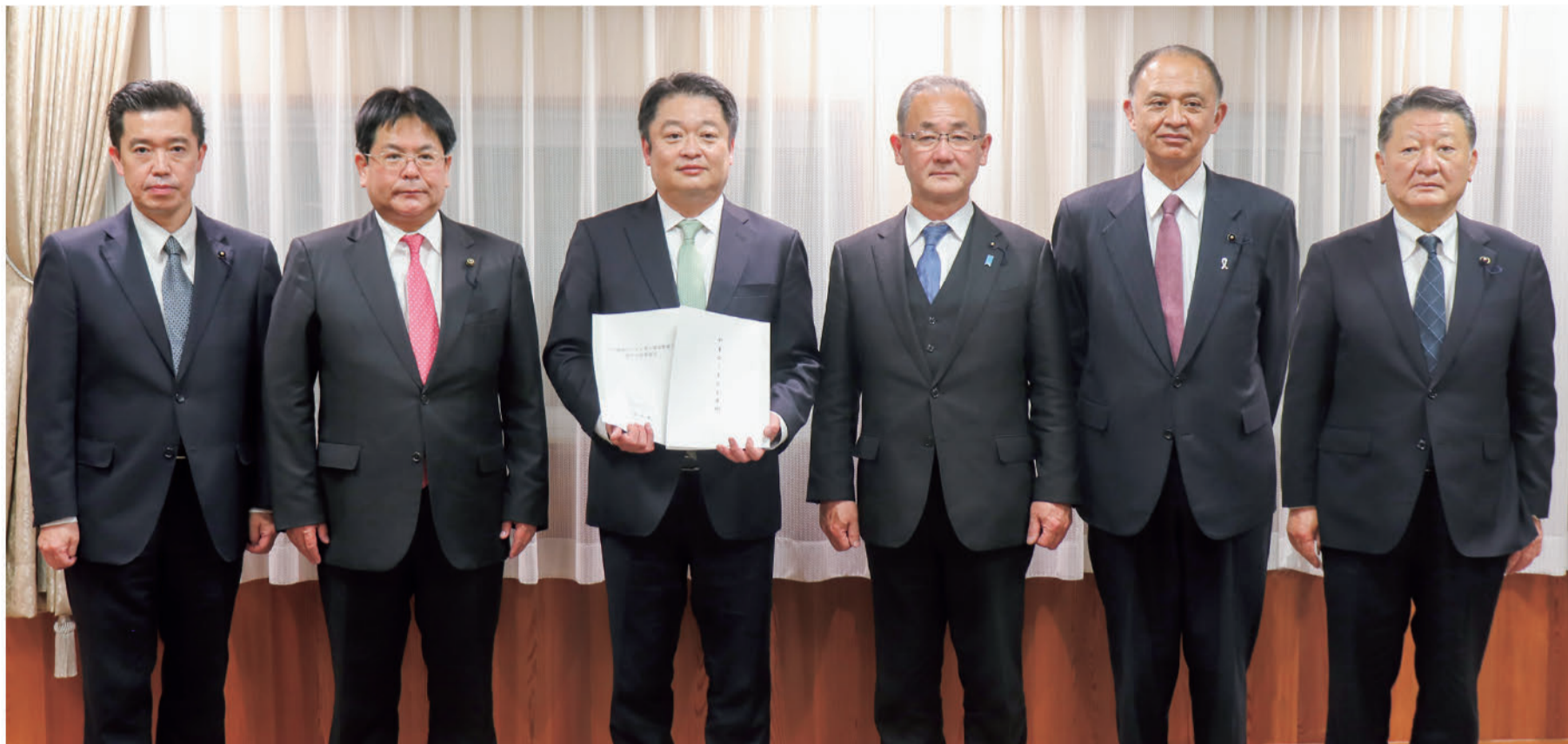
長崎知事に「やまなし子ども条例」「公共施設のトイレ等の環境整備に関する政策提言」を手交 (左から佐野弘仁議員、桜本広樹議長、長崎幸太郎知事、杉山肇副議長、飯島修議員、猪股尚彦議員)