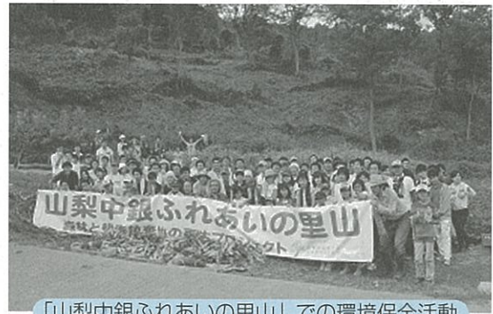
「山梨中銀ふれあいの里山」での環境保全活動