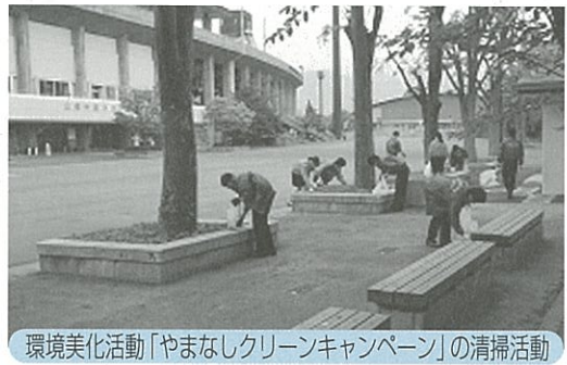
環境美化活動「やまなしクリーンキャンペーン」の清掃活動

山梨県が推進する環境美化活動「やまなしクリーンキャンペーン」および「エコドライブ」運動に参加して、店舗周辺の道路・公園等公共の場の清掃活動や、環境に配慮した運転を行い、全行を挙げて環境美化・環境保全活動を展開しております。「平成24年度やまなしクリーンキャンペーン」では、延べ3,851名が参加し、延べ1,128ヶ所の清掃を行いました。また、「エコドライブ運動」には、433台の所有車両および2,422名の役職員が参加しております。