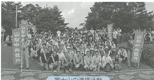
富士山の清掃活動