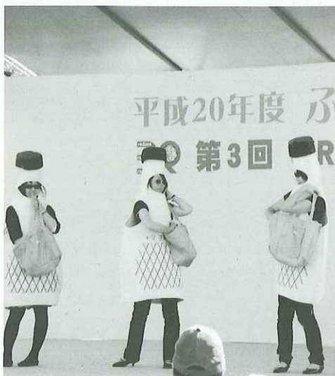
ファッションショーの様子

3R推進関東大会inやまなしが10月18日、19日に小瀬スポーツ公園で開催されました。