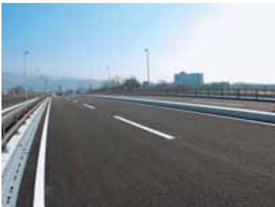
甲府駅北口へと延びる愛宕町下条線

このような中、2月7日に半世紀にわたる友情の結晶である「フジザクラポーク」とアメリカ産食材をテーマにした「山梨・アイオワ友好交流レシピコンテスト」を開催しました。今回選ばれたレシピは、4月にアイオワ州代表団を迎え開催される記念行事で活用します。