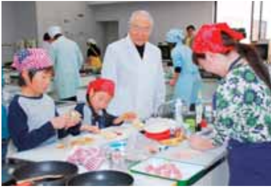
服部栄養専門学校 服部幸應校長を ゲスト審査員に迎え行われたコンテスト