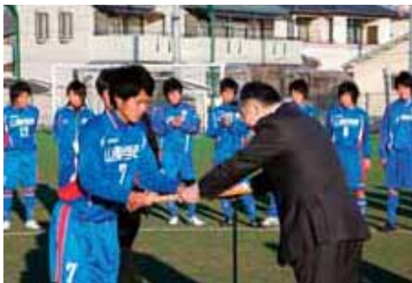
「山梨県イメージアップ大賞」に輝いた 山梨学院大学附属高等学校サッカー部

1月19日、山梨学院大学附属高校サッカー部に「山梨県イメージアップ大賞」が贈られました。この賞は、スポーツ、芸術、文化、産業などあらゆる分野で県民に感動を与えるような活躍をし、本県のイメージアップに貢献した個人・団体に贈られます。山梨学院大学附属高等学校サッカー部は、第88回全国高校サッカー選手権大会に初出場で初優勝を成し遂げました。この優勝は、サッカーファンのみならず、多くの県民が待ち望んでいたもので、県民に大きな感動と郷土への誇りを与えてくれました。