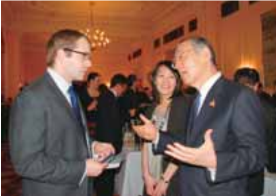
甲州ワインの魅力をアピールする横内知事

県内のワイナリー15社などで構成する「EU輸出プロジェクト委員会」は、甲州ワインのプロモーションイベントを世界のワイン情報の発信地である英国・ロンドンで、1月12日から15日まで行いました。これにあわせ横内知事は、甲州ワインの認知度向上、販路拡大を図るためのトップセールスを現地で行いました。