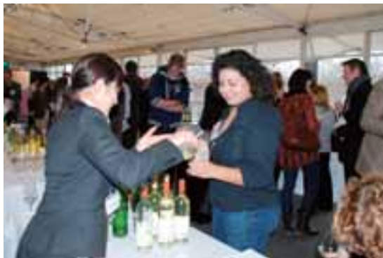
ソムリエなどを対象に行ったテイastingイベント

今回のプロモーション活動で、甲州ワインは期待を上回る大きな反響がありました。本格的な輸出につなげられるよう、県では、これらのプロモーション活動を今後も支援していきます。