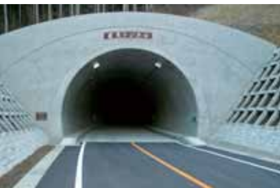
甲府盆地と富士北麓を結ぶ「若彦トンネル」

県では、今後も中心市街地へのアクセス道路や、市街地内道路を整備するなど、住環境を改善し、誰もが暮らしやすさを実感できる都市づくりを進めていきます。