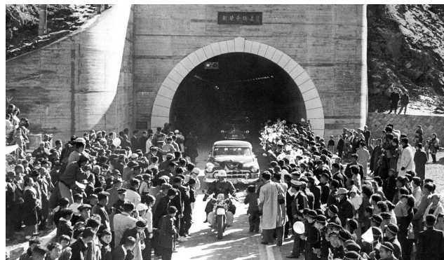
新笹子トンネル開通