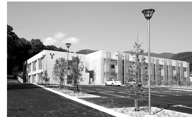
山梨大学燃料電池ナノ材料研究センター