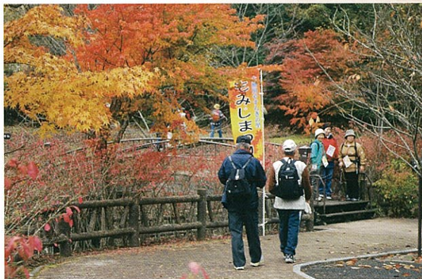
大柳川やすらぎの里 もみじ祭り

自然豊かなこの地域は、「南アルプス巨摩県立自然公園」に指定されている箇所もあり、北には頂に天然林が残る山梨百名山「源氏山(1,827m)」があります。