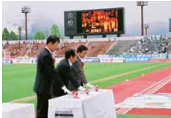
大型映像装置の点灯式