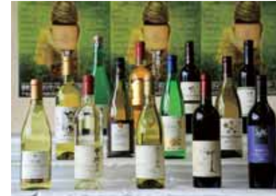
金賞を受賞した13点の国産ワイン

県では、俳優の菅原文太さんを農業協力隊推進事業のコーディネーターに内定しました。この事業は、農村地域の活性化を図るため、都市部から就農希望者を募り、農業の新たな担い手となるよう農業関係法人の指導のもと、生産活動や地域活動に参加していただきながら、山梨への定住・定着を進めていくものです。コーディネーターとなる菅原さんは、約11年前から農業を実践し、里山の復活や環境保護などの活動に取り組んでいます。今後は、水と空気がおいしい山梨県を拠点に農業活動を進めていきます。