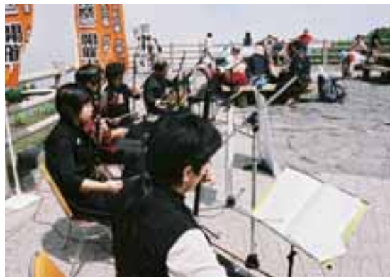
富士山五合目で行われたミニコンサート

小瀬スポーツ公園陸上競技場の大型映像装置が完成し、8月2日に点灯式が行われました。この日は、VF甲府対横浜FC戦が開催され、フルカラーの大型ビジョンにゴールシーンが再生されると、スタンドから大きな歓声が沸き、陸上競技場全体が、多くのサポーターの応援で熱く盛り上がりました。迫力ある映像を体感することができるこの大型映像装置は、今後さまざまなシーンを映し出していきます。