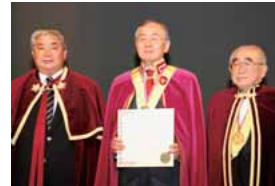
ソムリエ・ドヌール(名誉ソムリエ)に就任した横内知事

国内で栽培されたブドウを100%使用したワインを対象にした「国産ワインコンクール2009」審査会が、7月29日から3日間にわたり行われました。国産ワインの品質や認知度の向上を図ることを目的に行われるこのコンクールは、今年度で7回目を迎え、22道府県101のワイナリーから過去最多の680本が出品されました。審査では、外国人審査員を含む24名の審査員が、会場に並べられたワインの色や香り、味などを確かめました。8月7日には、審査結果が発表され、入賞した268点のうち金賞は13点で、このうち山梨県産ワインは、昨年より2点多い8点が受賞しました。また、8月29日には表彰式、公開テイスティングが開催され、会場では大勢の来場者が、受賞したワインを堪能していました。こうした国産ワインコンクールの拡充やトップセールスで県産ワインを広めていることなどが高く評価され、8月11日には、横内知事が日本ソムリエ協会が認定するソムリエ・ドヌール（名誉ソムリエ）に就任しました。県では、今後も県産ワインが世界中で認められるよう普及活動に力を入れていきます。