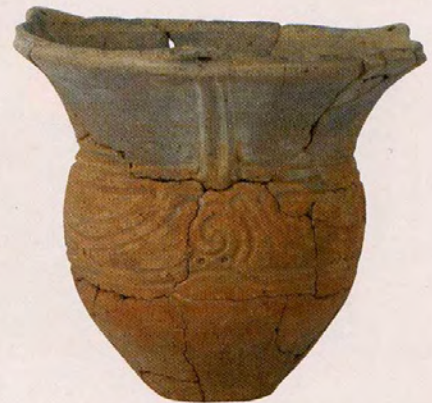
丸めの胴部とラッパのように開く口縁が特徴的です。

この時期は、精製土器と粗製土器がセットで作られるといわれます。精製土器は表面を棒状の工具や石でよく磨き、文様をつけた光沢のあるきれいな土器です。祈りや信仰に使う土器と日常生活で使うものと使い分けていたのかもしれませんが。