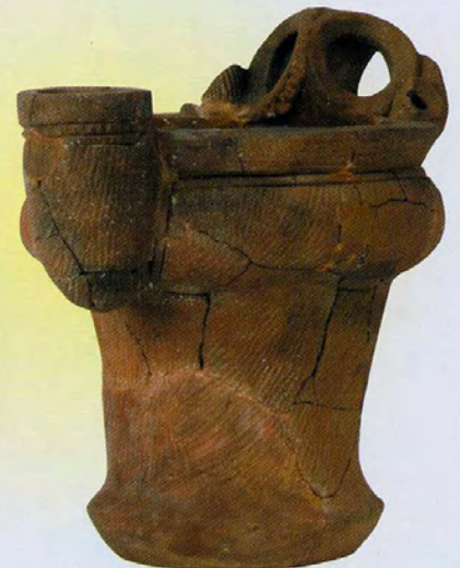
海道前C遺跡（北杜市）