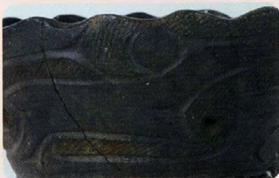
雲が流れるような文様