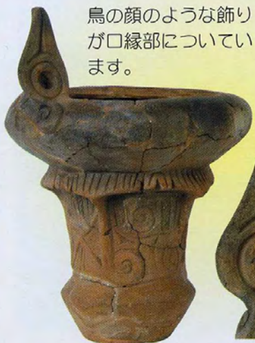
海道前C遺跡（北杜市）