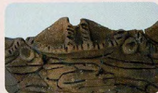
口縁に顔のような文様