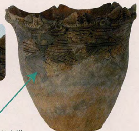
矢羽根のような文様