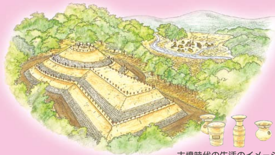
古墳時代の生活のイメージ

古墳という特別なお墓をつくる時代です。弥生時代から続く習慣も残りますが、生活の中では大陸から須恵器・カマドなど新しい文化が入ってきて、その文化が広まっていく時代です。