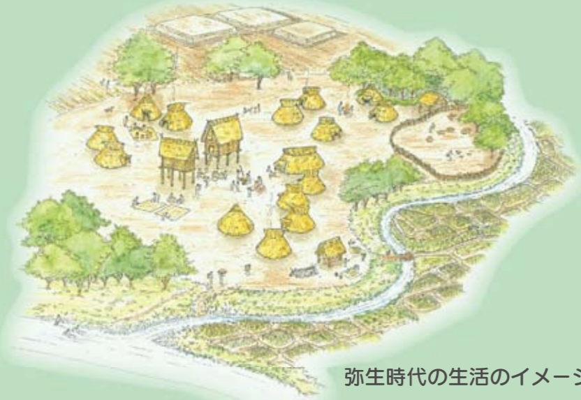
弥生時代の生活のイメージ

米づくりを中心とした農耕、金属器やガラス等の貴重品は、この時代に大陸から伝わりました。また、縄文時代から続く習慣と、新しい文化が融合する時代です。