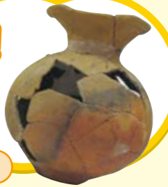
このような土器を復元・修理しました。

山梨県埋蔵文化財センターでは、多くの児童・生徒が実物を手に取ることができるように、土器の貸出をしています。昨年度は、埋蔵文化財センターにある縄文土器の復元・修理を行い、今年度は弥生時代2遺跡・古墳時代8遺跡の土器を復元・修理しました。この機会にぜひご活用頂きたいと思ます。