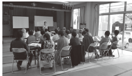
平成28年度 高齢者向け出前講座の様子 テーマ：「消費者トラブルの事例と対処法」