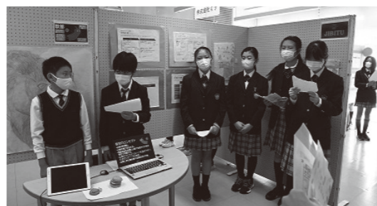
6年生「起業プランコンクールに挑戦」の様子の様子(山梨学院小学校)