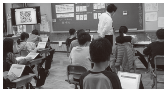
5年生「買い物の仕方を工夫しよう」の様子の様子(韮崎北東小学校)