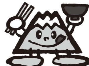
やまなし食育推進マスコット ふじペロりん