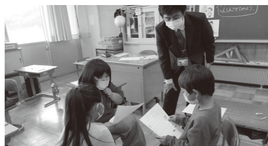
2年生「いつまでも大切に」の様子の様子(韮崎北東小学校)