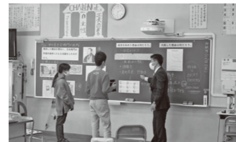
6年生の授業の様様

金融・金銭教育研究校で、金融教育公開授業を開催し、金融・金銭教育に関する公開授業、昨年度から取り組んできた研究の発表、金融教育の専門家による講演会を行いました。