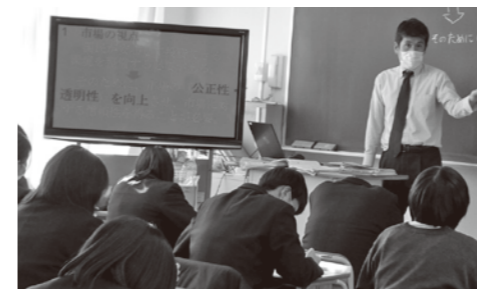
「経済活動と法」の授業の様様