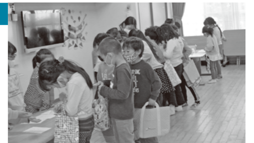
年長の保育「お店屋さんごっこ」の様様

3つのチームに分かれ、塗り絵屋さんを出店。お店ごとに異なるキャラクター、異なる金額(50円、100円、150円)を設定し、各チームでさらに紅白の2チームに分かれ、前半はそれぞれ赤チームが店員さん、白チームがお客さん、後半は紅白の役割を入れ替えて店員さんとお客さんの両方を体験。お店屋さんごっこを通して売り買いに必要な言葉、物を大切に扱うこと、売れた時の喜びなどを学びました。