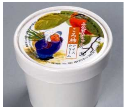
(株)なかむらにより試作販売中の「ころ柿のアイスクリーム」

新商品又は新役務の内容とその市場性・競争力 生産者と消費者の顔の見える関係から生まれた高品質の原材料にこだわり、さらに果肉をアイスクリームに練り込むことで、これまでにない新しい食感を生み出した、安心・安全でおいしいアイスクリームを製造、販売。 需要開拓方針として、従来の販路である、清里高原や峡東果実郷の観光客への販売に加え、本物志向で舌の肥えた富裕層を主な顧客として設定。