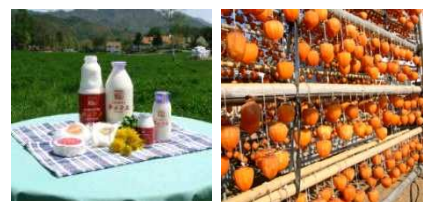
清里ミルクプラントの乳製品と、なかむらのころ柿

連携の経緯 (株)なかむらは、佐賀県の事業者と共同で「ころ柿のアイスクリーム」を企画開発し、試作販売を行ってきたが「フルーツ王国」山梨県の完熟フルーツと清里の高品質の原乳を用いた新たなアイスクリームを製造することで「山梨の果実ルネッサンス」を目指して、新たに(有)清里ミルクプラントとの連携を開始。 また、新商品の新たな販路開拓を目指して、(株)渡辺商店の物流網・販売チャネル活用した連携を予定。