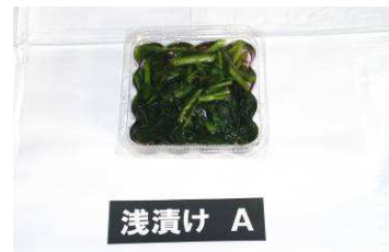
クレソン漬物試作品

新商品又は新役務の内容とその市場性・競争力 市場では、食の安全・安心志向、健康志向が高まる中で、ポリフェノール含有量が多いクレソンの漬物は、高級漬物ブランドとして位置づけられものと期待できる。 山梨県工業技術センターにおける試験研究によると、クレソンは、人の健康における抗酸化、高血圧予防および抗アレルギー性効果を有するポリフェノール含量が高いことを明らかになっており、本事業では、これらの機能性効果を充分活用した日本初のクレソン漬物数種を開発することで新たな需要開拓が大いに期待でき