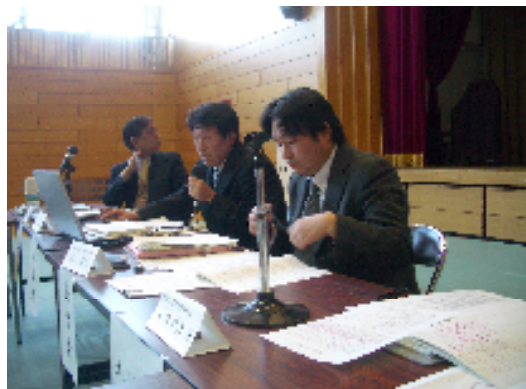
2月3日(金), 事例研究会