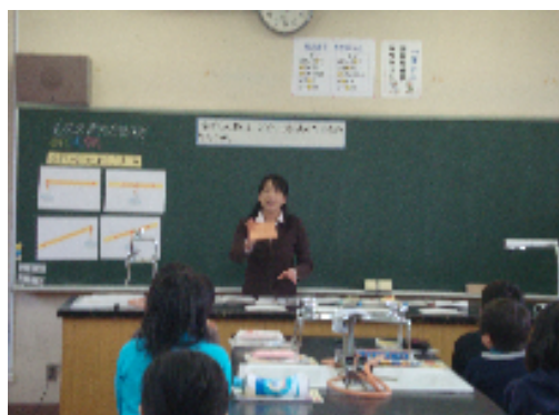
2月1日(水), 小学校4年生理科