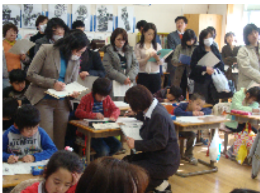
2月8日(水), 1年生国語 「くらべっこをしよう」～カンガルーの赤ちゃん