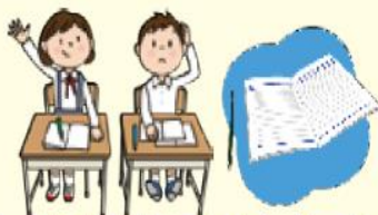
授業の工夫・改善②～④