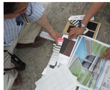
【現地における材料サンプルを用いた確認とアドバイザーにより決定した色彩一覧表】