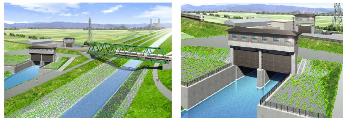
【アドバイザーの助言により採用することとなったイメージパース】