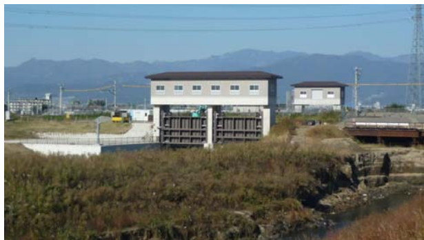
【樋門完成状況写真(周囲に溶け込んだ色彩)】