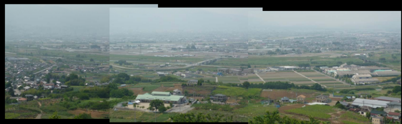
【遠方俯瞰 確認用資料】