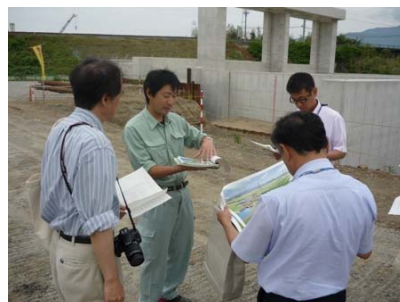
【アドバイザーによる遠方俯瞰・現地確認状況】