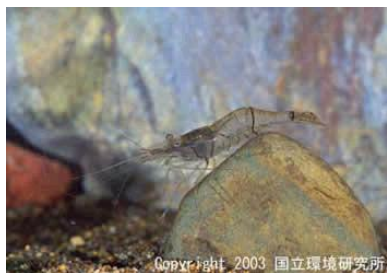
NO. 16 スジエビ