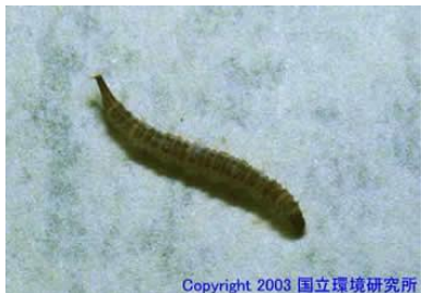
NO. 27 チョウハエ