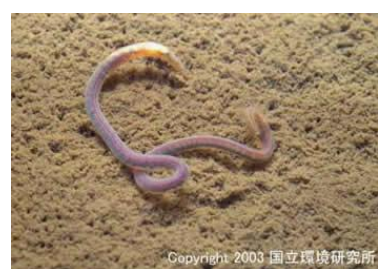
NO. 28 エラミス