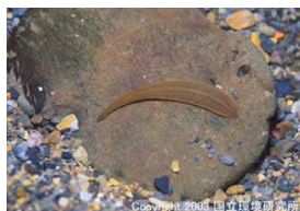
NO. 22 ヒル