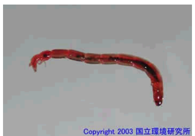
NO. 26 セシジユスリカ