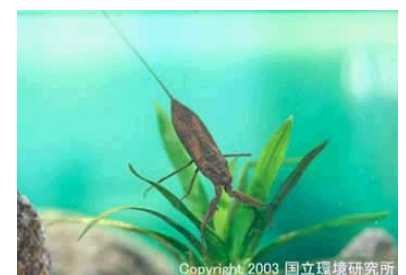
NO. 21 タイコウチ