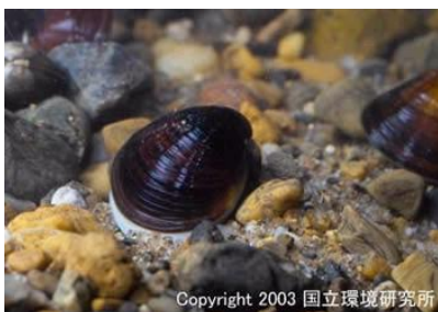
NO. 17 ヤマトシジミ