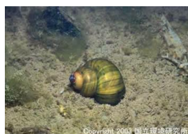
NO. 23 タニシ