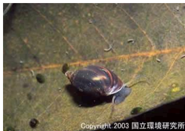
NO. 29 サカキガイ