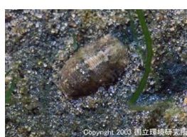
NO. 24 イソコツブムシ