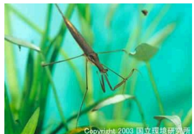
NO. 20 ミズカマキリ