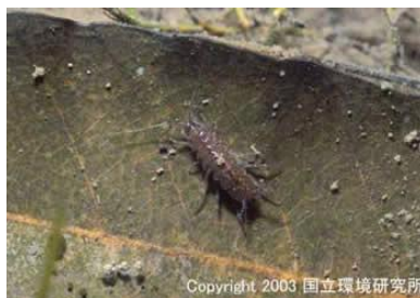
NO. 19 ミズムシ