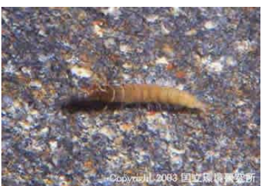
NO.10 コガタシマトヒケラ