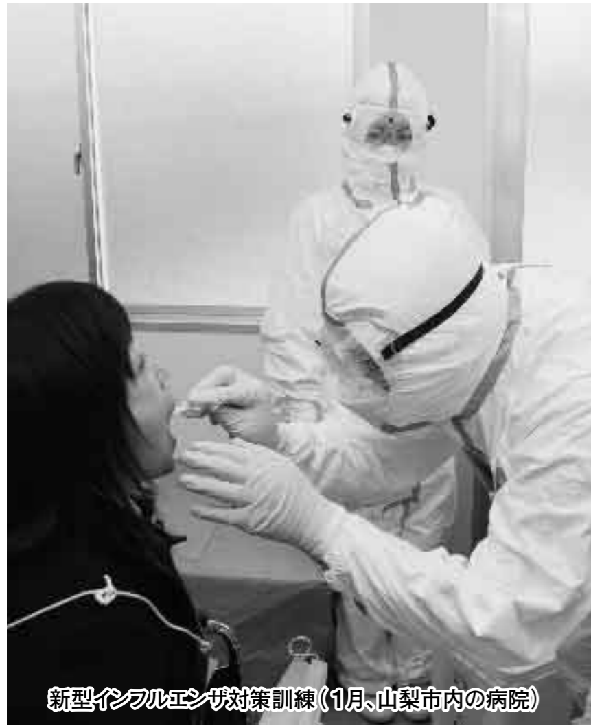
新型インフルエンザ対策訓練(1月、山梨市内の病院)

新型インフルエンザは、鳥インフルエンザウイルスが変異して、人から人への感染力を持つようになったときに発生する新しいタイプのインフルエンザです。人には免疫がないため、いったん発生すると短期間に感染が広がり、世界的流行を引き起こす危険性があります。厚生労働省では、国内での感染者は最大3200万人、死亡者は最大64万人に達すると試算しています。近年、東南アジアを中心に鳥インフルエンザウイルスが、人へ感染する事例が多く報告されており、新型インフルエンザの発生が危がされています。発生に備えて、今から対策をしておきましょう。