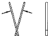
アリゲーター運動