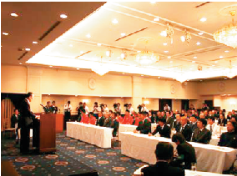
●5月6日開催のアグリマスター委嘱・研修開始式の模様

本年度は果樹を中心に21組23名の研修生が県内各地で研修を実施しています。数年後には、地域の農業を支える担い手に成長することを期待しています。