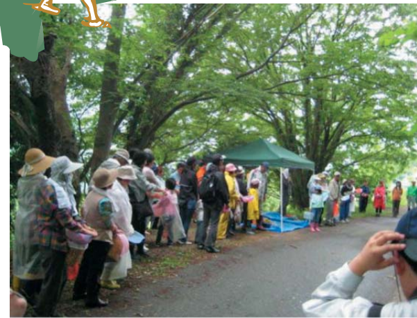
●当日集まった参加者