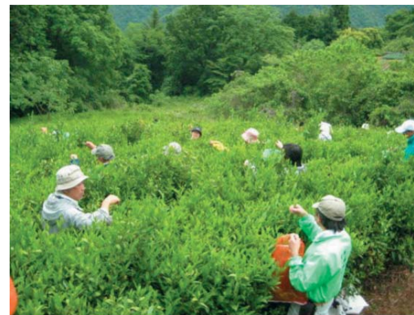
●茶摘み体験の様子

今年度は、「タケノコ狩り体験」に次いで2回目となる「茶摘み体験」が、5月24日(日)に身延町丸畑地区の茶畑で行われました。県内外から家族連れ37名が参加し、一番茶の収穫を楽しみました。