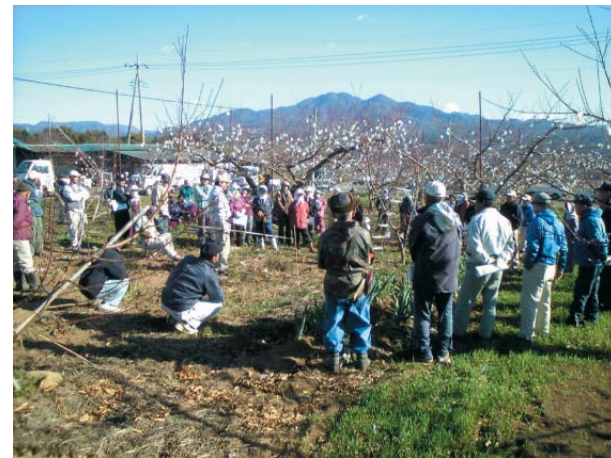
●病虫害防除と整枝剪定講習会