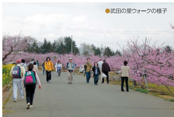
●武田の里ウォークの様子

本年2月13日の全国環境保全型農業推進会議でJA梨北「新府桃共選場」の取組が優秀賞（全国農業協同組合中央会会長賞）に選ばれ、3月25日に関東農政局において、表彰状の伝達式と受賞者の事例発表が行われました。