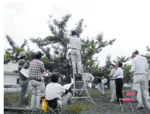
●ももの袋かけ講習