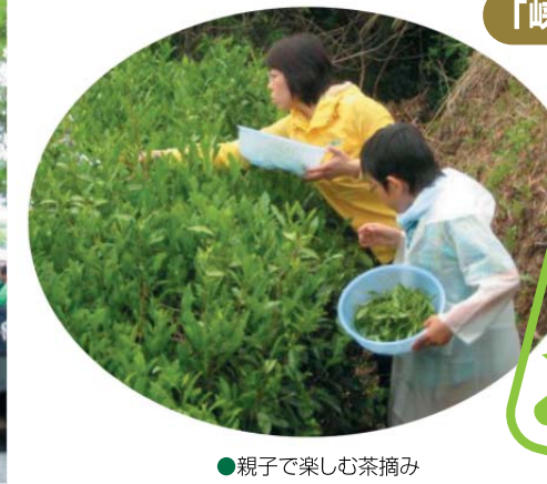
●親子で楽しむ茶摘み