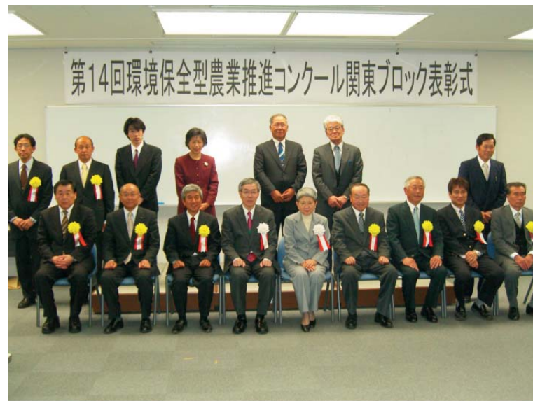
●受賞者の記念写真（上段左側から2人目と3人目）