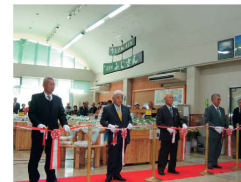
●オープニングイベント

この結果、昨年の12月には、「ふじさん出荷組合」が設立され、本年3月24日には「ふじさん」という名称で直売所がオープンしました。これにより、生産者の意欲が一層高まり、周年出荷に向けた施設栽培の検討や、新規加工品開発への取り組みが活発化しています。