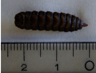
ミズアブ幼虫 体長:約23mm