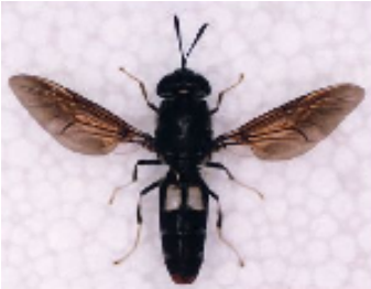
アメリカミズアブ成虫 体長:約15~18mm ゴミ溜めなどに発生 (外来種)