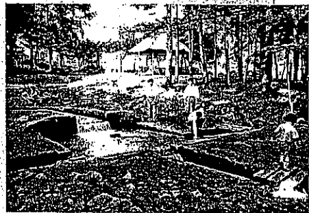
⑤泉ライン名水と野鳥の里(三分一湧水)