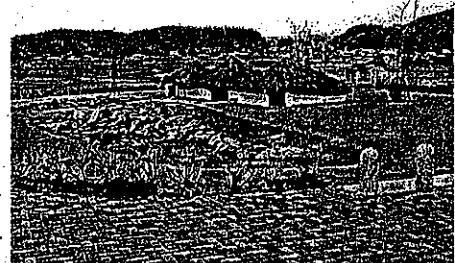
⑥下流とミステリアスな歴史の里(金生遺跡)