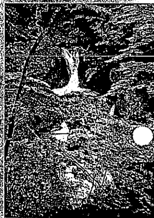
②清流と浮葉の里(宮司の滝)