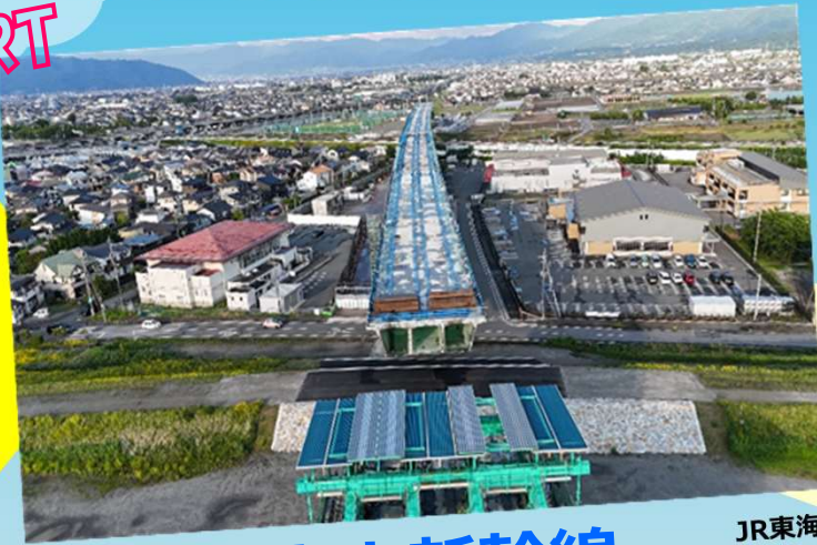
リニア中央新幹線 釜無川橋りょう工事