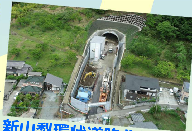
新山梨環状道路北部区間 アクセス道路トンネル工事