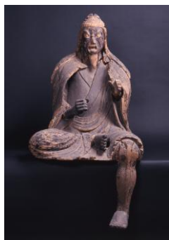
円楽寺の木造役行者倚像(甲府市右左口町)