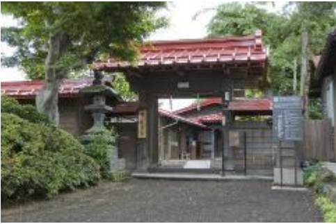
旧外川家住宅(富士吉田市)