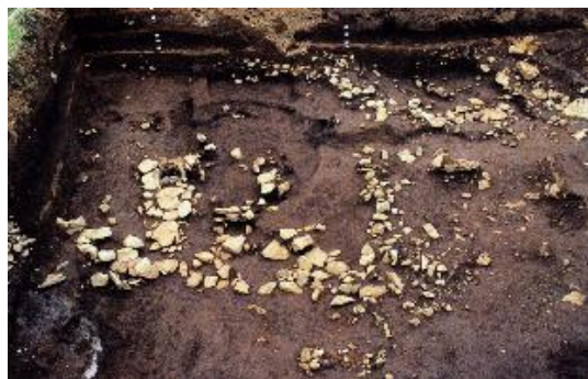
池之元遺跡の住居址(富士吉田市新倉)