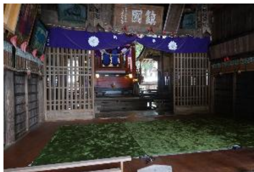
河口浅間神社拝殿(富士河口湖町河口)