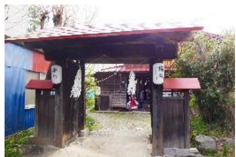
4 川口御師「梅屋」の門(富士河口湖町河口)