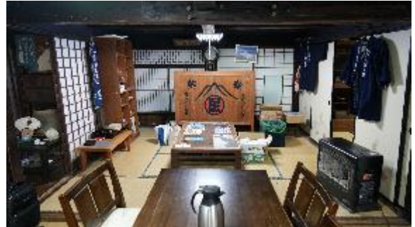
御師「菊谷坊」の屋内(富士吉田市)