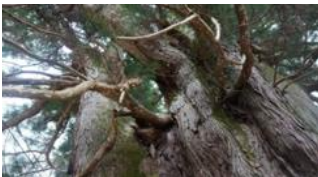
精進の大杉(国指定天然記念物)