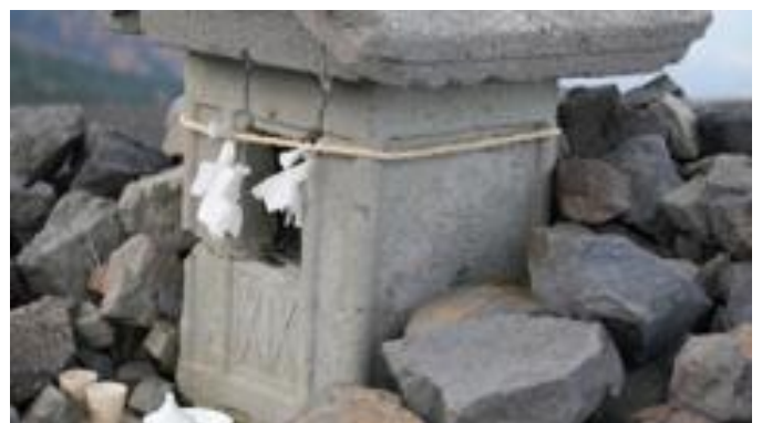
扶桑教が祀った石造の祠