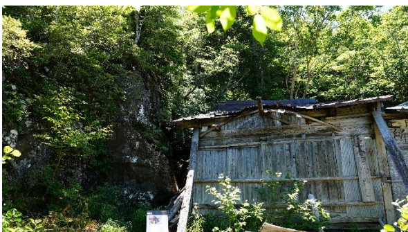
四合五勺御座石の現況