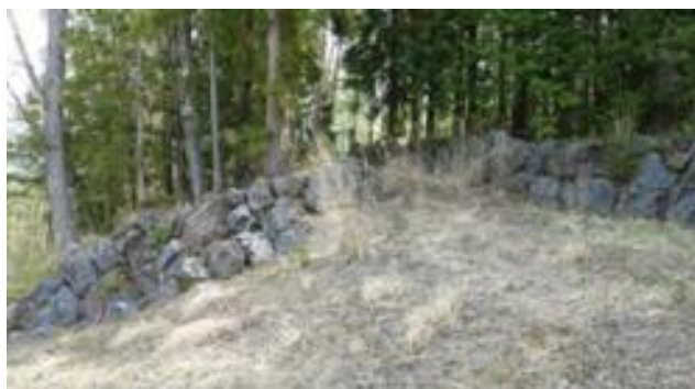
マンガイ(万杭)の石垣