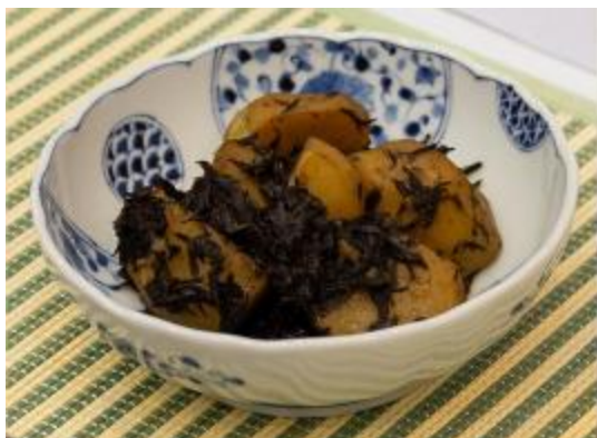
ジャガイモとヒジキの煮物