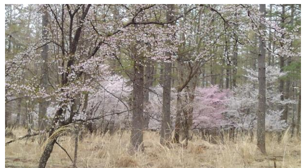
中ノ茶屋周辺のフジザクラの群落