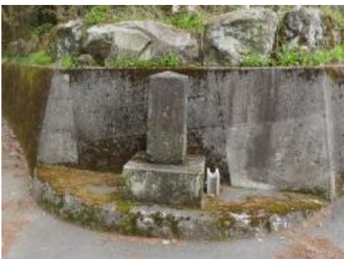
神野路の分岐点を示す石造の道標