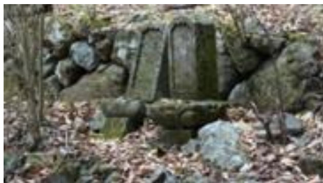
女坂(阿難坂)付近の石碑