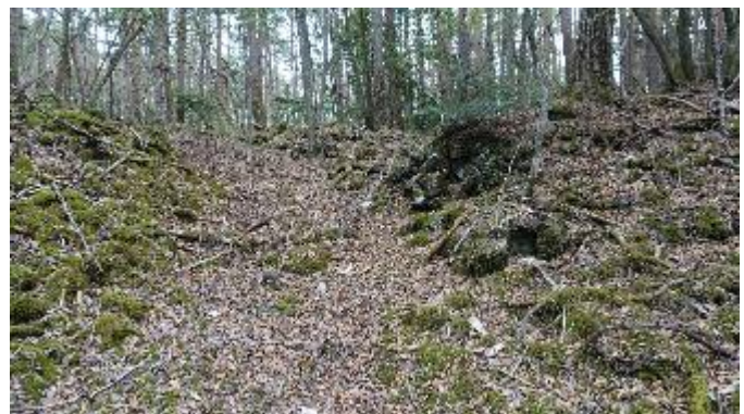
船津公園墓地の先の現況

※これまでの調査研究等に基づき、現地の状況や過去の記録などから道筋が判明・確認されたとする区間を「特定区間」、各種文献資料等の記述や絵図などから推察はできるものの、現況などでは確認に至らず特定できていない区間を「推定区間」としている。