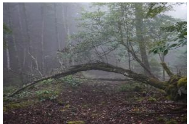
船津口登山道現況