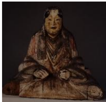
忍草浅間神社の木造神像(忍野村忍草)