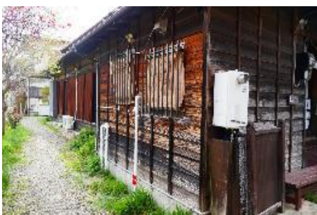
川口御師「梅屋」(富士河口湖町河口)