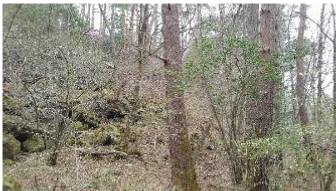
吉田胎内の取付道周辺の現況