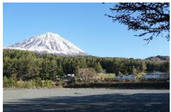
天神峠東方に立地するスキー場