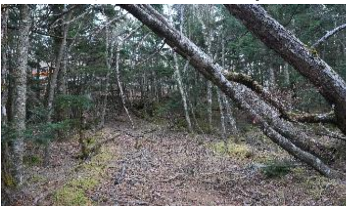
船津口登山道現況