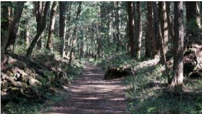
精進口登山道現況