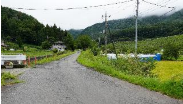
大明見地区の現況