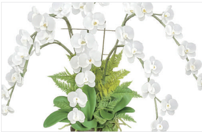
ジュエリーマスター(宝石加工・R7認定) 河野 祐一郎

高度な技術を持つジュエリー制作分野の技術者を、山梨県が「ジュエリーマスター」に認定します