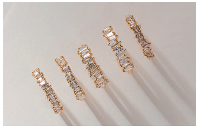
ジュエリーマスター(宝飾加工・R7認定) 新井 七奈香

山梨県立宝石美術専門学校宝石貴金属加工学科卒業。甲州水晶貴石細工伝統工芸士。「河野製作所」の代表を務め、置物を中心に、幅広いジャンルの水晶貴石美術彫刻品の制作に携わっている。