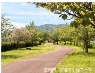
韮崎市・幸福の小径コース

C.C.Cafe LaLa茶 (竜王駅徒歩約56分) 定休日 日・月・木曜日 *臨時休業あり 特典 全品50円引き *支払いは現金のみになります。