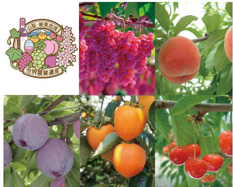
栽培される多種多様な果実

峡東地域では、扇状地特有の傾斜や起伏、土壌などの異なる自然条件や多雨・湿潤な気象条件に適応するため、効率的で独特な土地利用が行われてきました。適地・適作により、10品目以上、品種・系統数は300以上の多種多様な果樹を栽培する地域であり、卓越した栽培技術のある生産者が芸術品とも言える世界トップレベルの品質の果実を生産し、収益性の高い農業経営を実現しています。