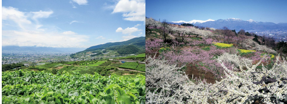
峡東地域には、果樹栽培による四季折々の美しい農村景観が広がる

世界農業遺産とは、社会や環境に適応しながら何世代にもわたり継承されてきた独自性のある伝統的な農林水産業とそれに密接に関わって育まれた文化、景観、生物多様性などが一体となった、将来に受け継がれるべき重要な農業システムを認定する制度です。古くから果樹の産地として知られ、独自の栽培技術や果実加工技術など、世界に誇る特色を持つ「峡東地域の扇状地に適応した果樹農業システム」が、令和4年、世界農業遺産に認定されました。