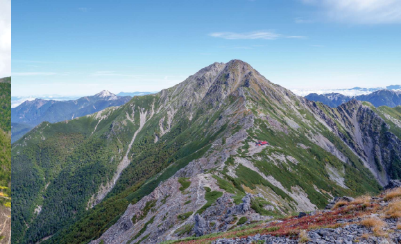
赤石山脈の高い山々と深い谷