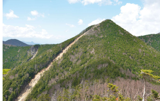
奥秩父主稜の中心に位置する甲武信ヶ岳