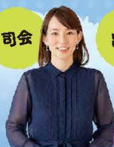
三浦実夏 (フリーアナウンサー)