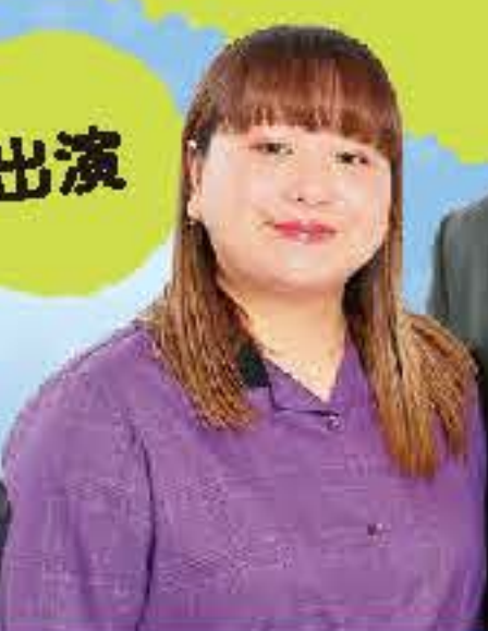
世間知らズ (お笑い芸人)