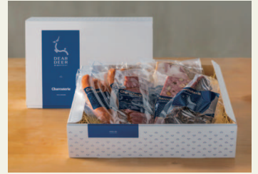
富士北麓で捕獲されたジビエを使用した「ジビエソーセージなど」 (Charcuterie by DEAR DEER)