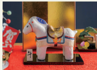
めでたやのお正月商品

事業者 株式会社澤田屋 代表取締役 黒澤 晋太郎 クリエイティブディレクター 株式会社DEPOT 宮川 史織 デザイナー 株式会社トンボロデザイン 若岡 伸也 株式会社 S PLUS ONE 建築設計事務所 坂野 由美子 株式会社ビジュアルアンドエコー・ジャパン