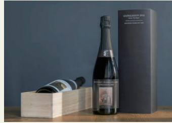
「EXPRESSION シリーズ」 1750年から紡ぐ七賢の持続可能なデザインの力