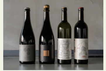
山梨の風土と人がつくる【甲州八珍果】と【醸造技術】で 持続可能な地域づくり ~98WINEs/98BEERs/stay366/一本~