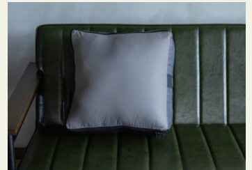
U80 SLEEPING BAG/ENVELOPE MULTI