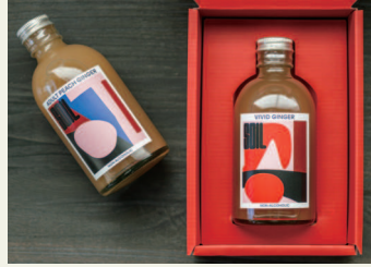
SOILジンジャーシロップ (6種類)