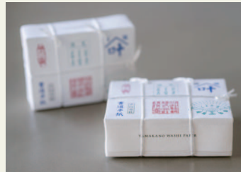
西嶋和紙 ミニチュア半紙一冊(ひとしめ)

事業者 株式会社 ふじよしまちづくり公社 代表取締役 堀内 茂 デザイナー 富士山ジビエセンター DEAR DEER 古屋 明広