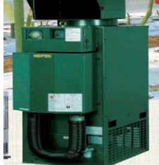
炭酸ガス発生装置