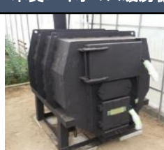
木質バイオマス暖房機