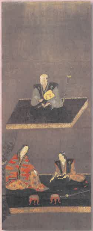
武田勝頼・妻子画像 (高野山持明院蔵) 展示期間4/9~5/6