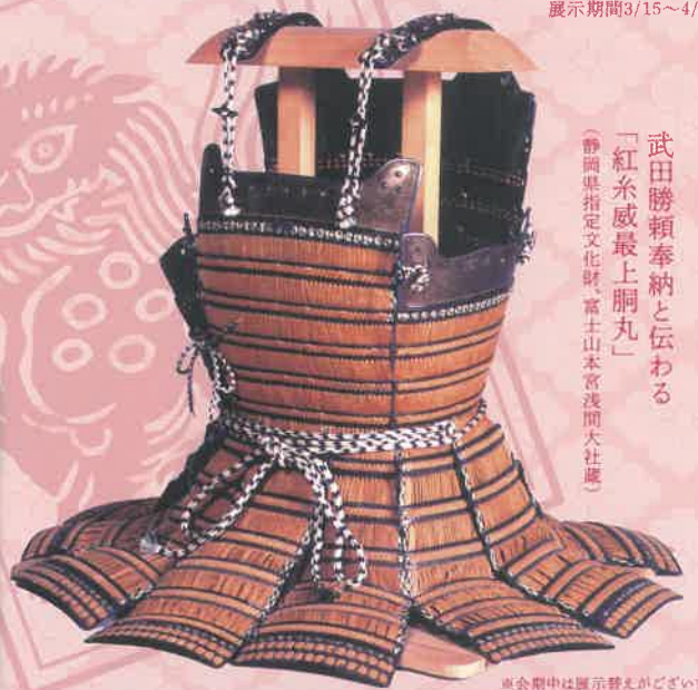
武田勝頼奉納と伝わる「紅糸威最上胴丸」 (静岡県指定文化財、富士山本宮浅間大社蔵)