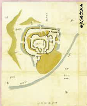
甲州新府之城図 (恵徳寺蔵 信玄公室物館保管)