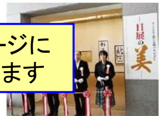
オープニングセレモニーでテープカットする長崎知事（左から2人目）と出席者

日 本最大級の美術展を開催する日展の会員による展覧会「アートシティ富士五湖プロジェクト一日展の美ー」が、河口湖美術館（富士河口湖町）で7月から3か月にわたり開催されました。 このイベントは、県と富士河口湖町、そして日展が、富士五湖地域を国際的なアートシティとすることを目指した取り組みの一つです。自然豊かなリゾート地と首都圏機能が融合した先進的の地域「自然首都圏」へと発展させる組織「富士五湖自然首都圏フォーラム」（本部：山梨県）の活動の一環として、初めて開催されました。 展覧会では、日本画や洋画、彫刻、工芸美術、書の5部門の作品が約100点展示されました。期間中には、子どもが本格的な日本画に挑戦するワークショップも開かれました。 日展の会員になるのは芸術家でも羨ましいとされています。その会員らによる最高峰の作品を間近で鑑賞できる貴重な機会となりました。 県では、富士五湖地域を、芸術家と交流して次々と作品が生み出されるような魅力と価値のあるアートの中心地としていきます。